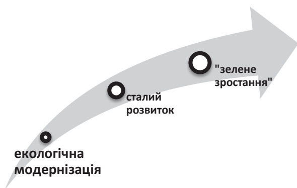
Рис. 3. Шляхи переходу до «зеленої економіки»

Важливим результатом модернізації та показником успішності реалізації стратегії сталого розвитку є ефект декаплінгу. Декаплінг є стратегічною основою руху до екологічно стійкої економіки, що дає змогу організувати економічно більш ефективно виробництво без підвищення впливу на навколишнє середовище (збільшення випуску продукції за зниження обсягу витрачених ресурсів). Цей ефект досягнуто практично в усіх розвинених країнах. Найбільш успішним прикладом може служити Данія, де за останні 30 років ВВП зріс удвічі за збереження обсягів споживання енергоносіїв. Найкращі показники мають Німеччина, Швеція, Японія, Південна Корея [8]. Доречно представити зв'язок між такими категоріями, як екологічна модернізація, сталий розвиток і «зелене зростання» (рис. 3).