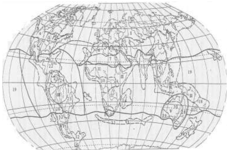
Рис. 1. Флористичне районування (за А.Л. Тахтаджяном, 1978)

I. Голарктичне царство: Області: 1 - Циркумбореальна; 2 - Східноазійська; 3 - Атлантично-Північноамериканська; 4 - Скелястих гір; 5 - Макаронезійська; 6 - Середземноморська; 7 - Сахаро-Аравійська; 8 - Ірано-Туранська; 9 - Мадреанська (Сонорська);