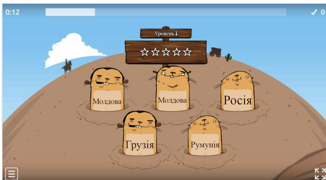
Рис. 3. Гра «Вдар крота» на платформі Wordwall. Тема гри «Країни-сусіди України» (авторська розробка, скріншот з екрану)

Ще один із варіантів створення інтерактивної гри на платформі Wordwall – це гра з не дуже гуманною назвою «Вдар крота» («рос. – «Ударь крота»). Правила гри: на екрані з'являються кроти, треба вдарити по тому із них, на якому написана правильна відповідь. Так, наприклад, вивчаючи тему «Українська держава», можна за допомогою цієї гри закріпити знання учнів щодо країн-сусідів України (рис. 3).