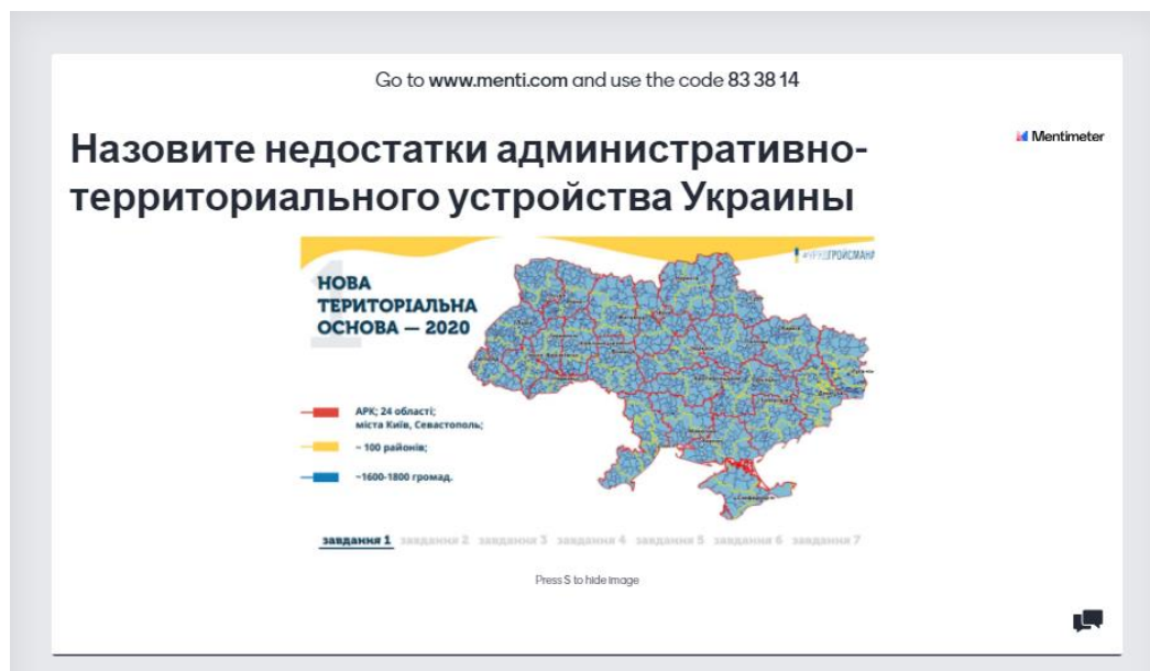
Рис. 4. Проведення контроль-рефлексійного етапу уроку на тему «Українська держава» за допомогою ресурсу «Mentimeter» (авторська розробка)

Крім ресурсу «Mentimeter», для проведення рефлексії змісту навчального матеріалу можна використовувати також більш відомі педагогічній спільноті ресурси Kahoot (щоб створити опитування: kahoot.com ; щоб взяти участь в опитуванні: kahoot.it ) та Socrative (щоб створити опитування: socrative.com ; щоб взяти участь в опитуванні: https://b.socrative.com/login/student/ ).