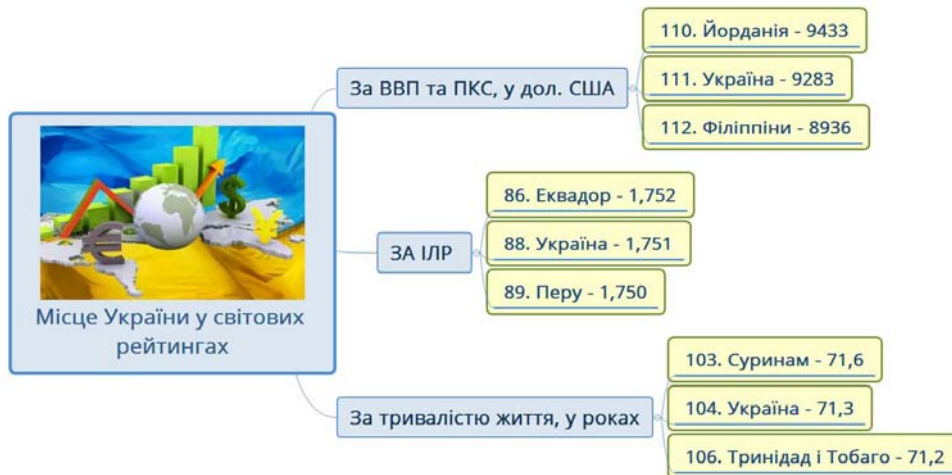
Рис. 3. Місце України у світових рейтингах у 2018 р.