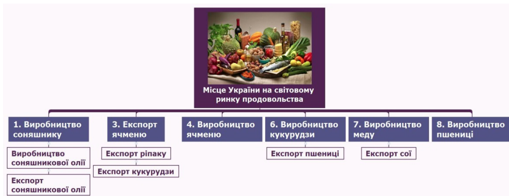
Рис. 5. Місце України на світовому ринку продовольства, 2016 р.

Значні конкурентні переваги Україна також має й на світових ринках рудної сировини. Це видобуток титану, цирконію, урану, літію, марганцевої (видобувають понад 42 % світових запасів) та залізної руди.