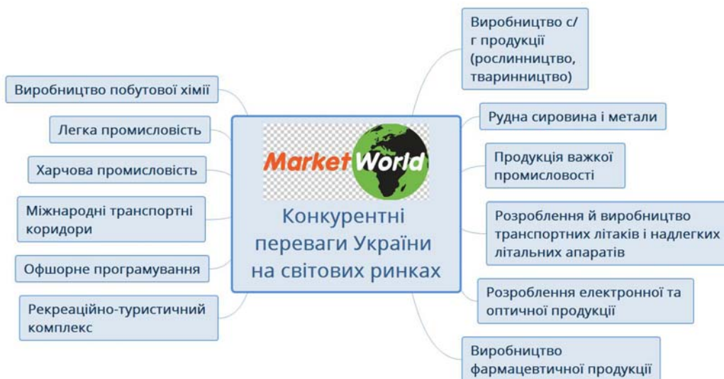
Рис. 4. Конкурентні переваги України на світових ринках

ІЛР в Україні у 2018 р. становив 0,75, тоді як майже у всіх країнах-сусідах України цей показник вище, а саме: у Російській Федерації та Білорусі – 0,82; у Польщі – 0,87; у Словаччині – 0,86; в Угорщині – 0,84; у Румунії – 0,82. Лише у Молдові ІЛР становив 0,71.