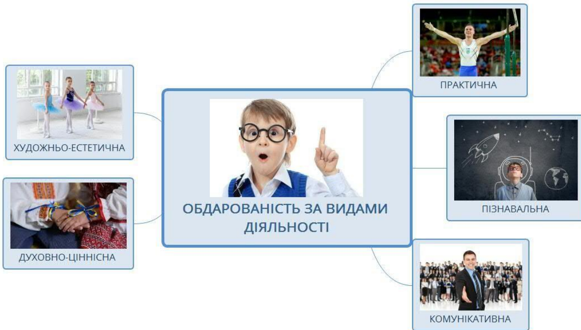
Рис. 2. Обдарованість за видами діяльності (складено авторами)

Як видно з рис. 2, за видами діяльності виділяють такі види обдарованості, як: