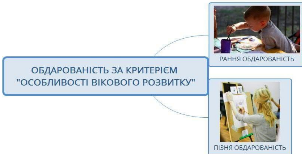
Рис. 6. Обдарованість за критерієм «особливості вікового розвитку» (складено авторами)

Як видно із рис. 6, рання обдарованість проявляється у дуже ранньому віці. Прикладом такої обдарованості є вундеркінди – діти дошкільного або молодшого шкільного віку із надзвичайними, блискучими успіхами в якомусь певному виді діяльності – математиці, поезії, музиці, малюванні, танцях тощо. Відповідно, пізня обдарованість проявляється у середньому та старшому шкільному віці.