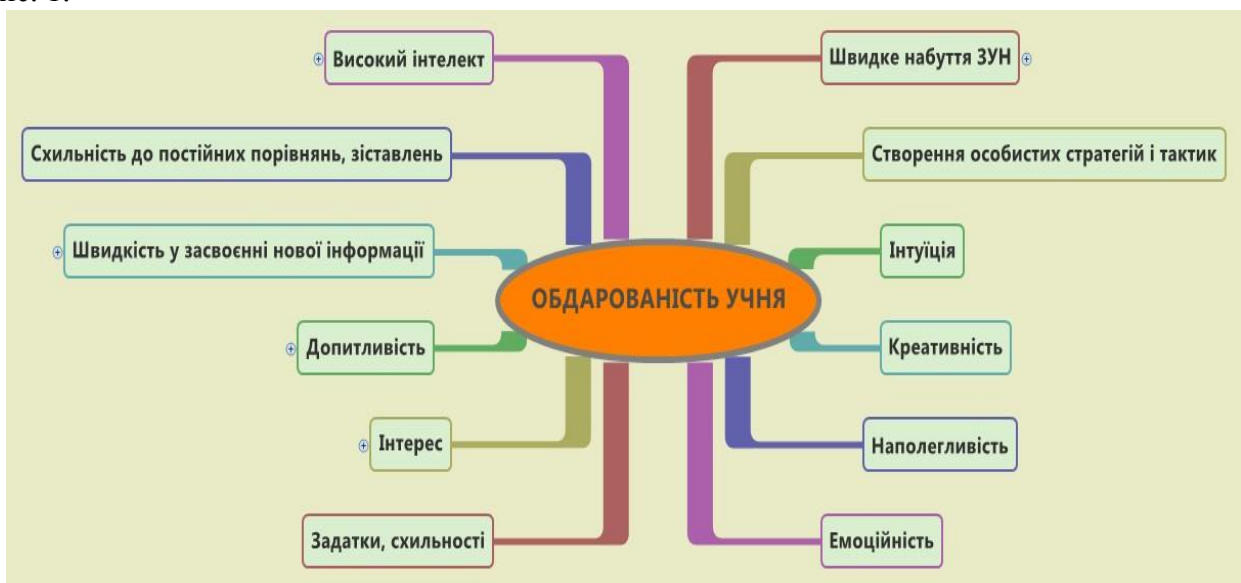
Рис. 1. Складові обдарованості дитини (складено авторами)

У більш стислому та наочному вигляді складові обдарованості дитини представлено на рис. 1.