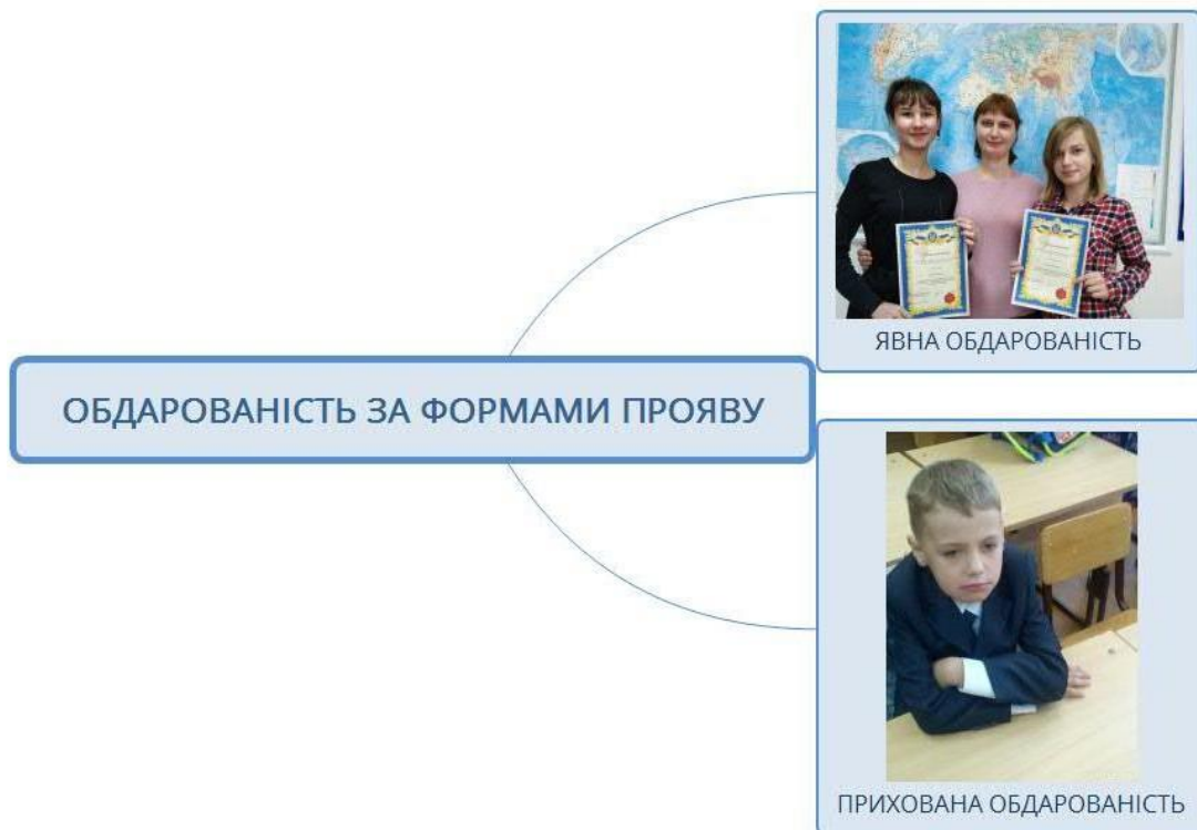
Рис. 4. Обдарованість за формами прояву (складено авторами)

Явна обдарованість виявляє себе у діяльності дитини досить яскраво і чітко (так би мовити «сама по собі»). Досягнення дитини настільки очевидні, що її обдарованість не викликає сумнівів. Натомість прихована обдарованість проявляється в атиповій, замаскованій формі, вона не помічається оточуючими. Дитину можуть віднести до числа «неперспективних». Причинами, що викликають феномен «прихованої обдарованості», можуть бути особливості соціокультурного середовища, у якому виховується дитина, особливості її взаємодії із оточуючими тощо.