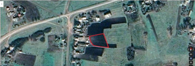
Додаток 1. Розораний участок у с. Лимарівка, де було знайдено залишки керамічних виробів на мапі „Google maps».

Предметом вивчення у цій роботі стали залишки глиняного керамічного посуду та інші керамічні вироби, які були знайдені на земельній ділянці в селі Лимарівка (Лимарівка-І) Біловодського району Луганської області (див. Додаток 1). Після