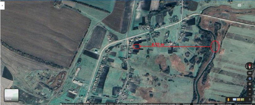
Додаток 2. Вигляд об'єкту Лимарівка – I на мапі „Google maps”.

Слід відзначити, що об'єкт Лимарівка-I розташовується на першій надзаплавній терасі правого берега р. Деркул, на розораній ділянці по вул. Набережна, 4. Русло р. Деркул знаходиться приблизно у 670 м. на схід від місцезнаходження (див. Додаток 2).