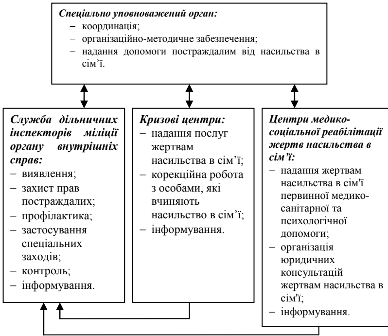
Рис. 2.1. Розподіл повноважень органів і служб щодо попередження насильства в сім'ї.

У загальному вигляді розподіл повноважень органів і служб щодо попередження насильства в сім'ї можна представити у вигляді схеми (рис. 2.1.).