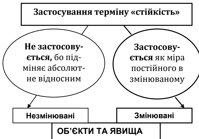
Рис. 1. Сфери застосування термiну «стiйкiсть»

Звiдси, користуючись принципом вiд «зворотного», можемо отримати наступний логiчно вивiрений семантичний висновок: «постiйне», застосовуване як синонiм «стiйкого», – не є «незмiнним». Отже, основна ознака термiну «стiйкiсть» – визначати постiйне в змiнюваному. Вiдобразимо результати проведеного аналізу сфери застосування термiну «стiйкiсть» схемою на рис. 1.