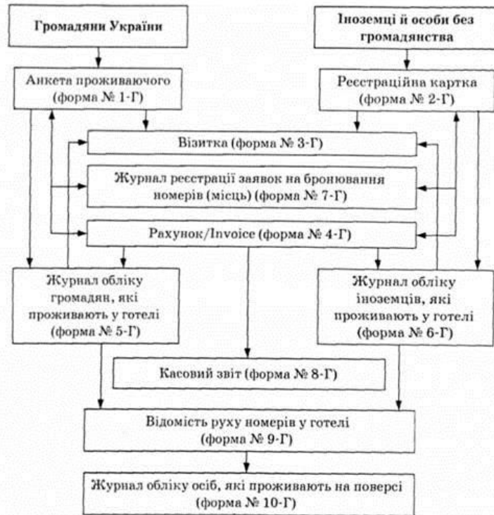
Рис. 1. Послідовність процесу заповнення технологічної документації в готелях