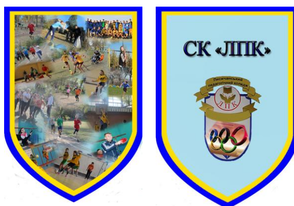
Рисунок 2. Вимпел спортивного клубу СК «ЛПК»

Основна мета СК «ЛПК» – об'єднання студентів, викладачів коледжу, співробітників, їхніх дітей, інших громадян для занять фізичною культурою, спортом, оздоровлення та популяризації здорового способу життя.