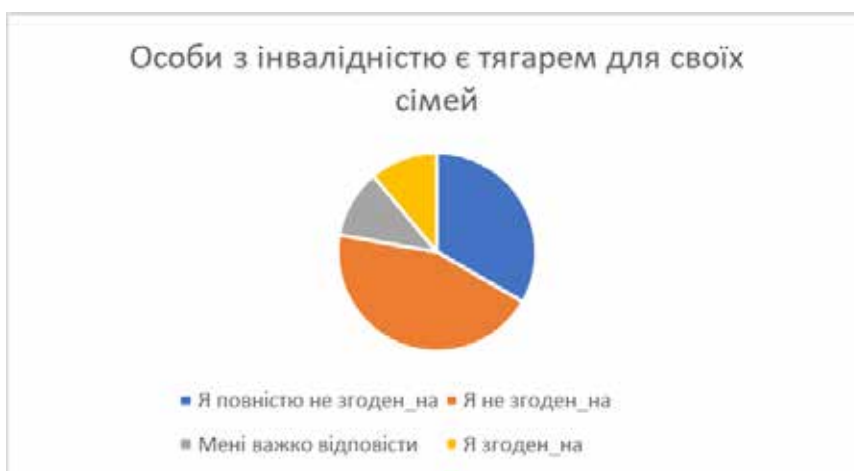
Рис. 1. Розподіл відповідей на одне з питань про інклюзію в суспільстві

Блок «Дискримінація» показав такі результати. Респонденти підтверджують тенденцію до заперечення, що в суспільстві є нерівне сприйняття й принизливе ставлення до осіб з інвалідністю (Люди часто висміюють осіб з інвалідністю – «Я не згоден_а – 65%). Але відповіді на питання про ризики стати жертвою експлуатації та жорстокого поводження відповіді розділилися між тими, хто згоден із цим твердженням (35%), не згодні (33%) та яким важко відповісти (32%).