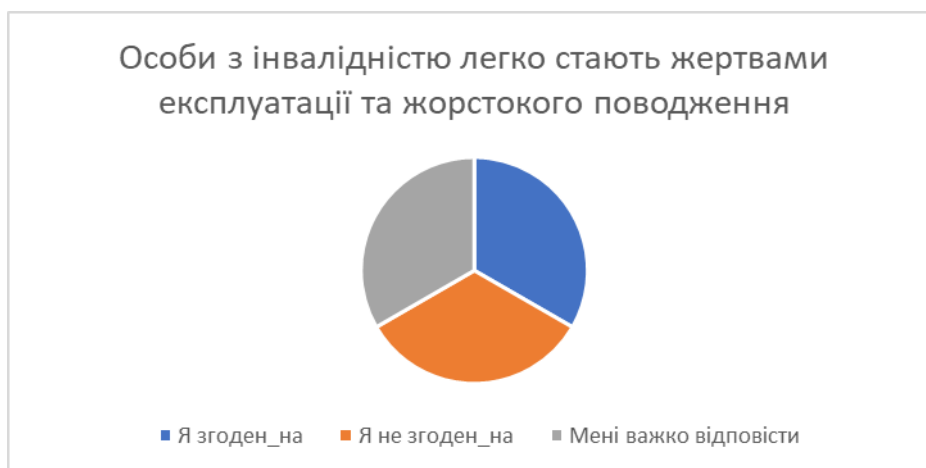
Рис. 2. Розподіл відповідей на питання про дискримінацію в суспільстві осіб з інвалідністю