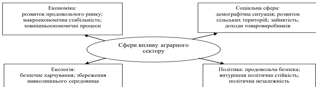
Рис. 1. Основні сфери впливу аграрного сектору економіки України

Як галузь економіки, аграрний сектор забезпечує населення продовольством, галузі промисловості сільськогосподарською сировиною та є основою безпеки країни, збереження сільського населення, його способу життя, забезпечення охорони природного ландшафту і навколишнього середовища. Виходячи з цього, роль аграрного сектора слід розглядати з різних позицій і, перш за все, з економічної, соціальної, екологічної та політичної (рис. 1).