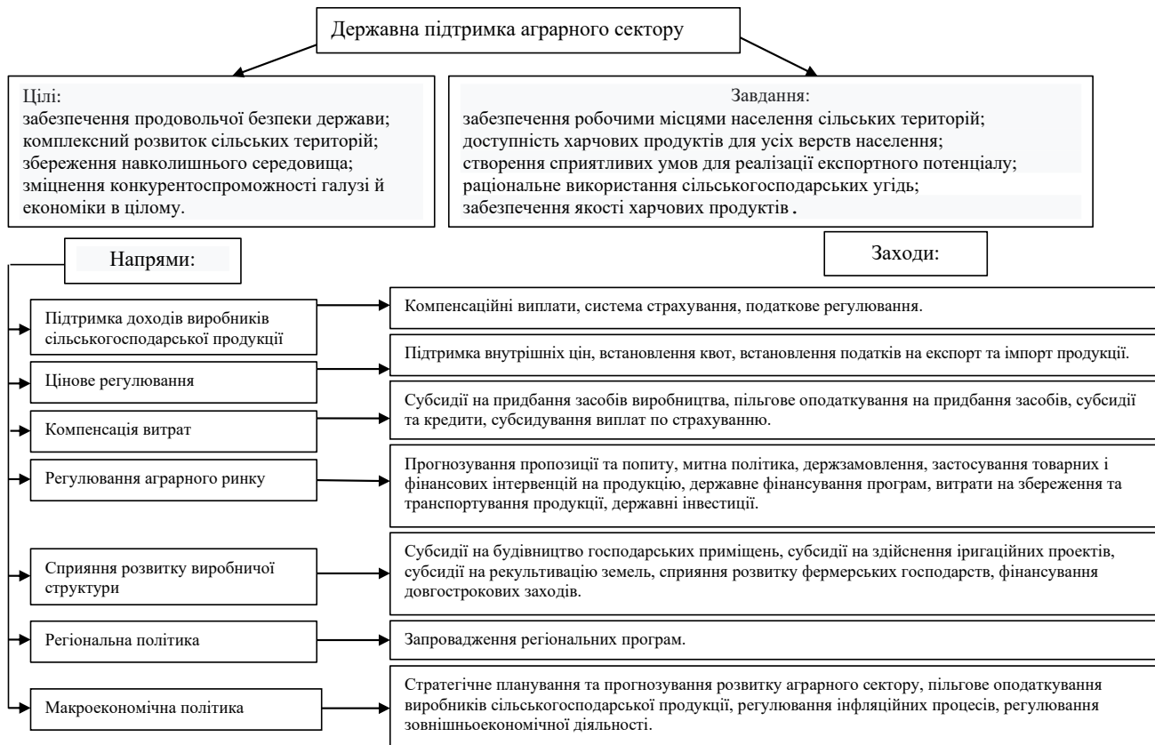
Рис. 3. Узагальнена схема державної підтримки аграрного сектору