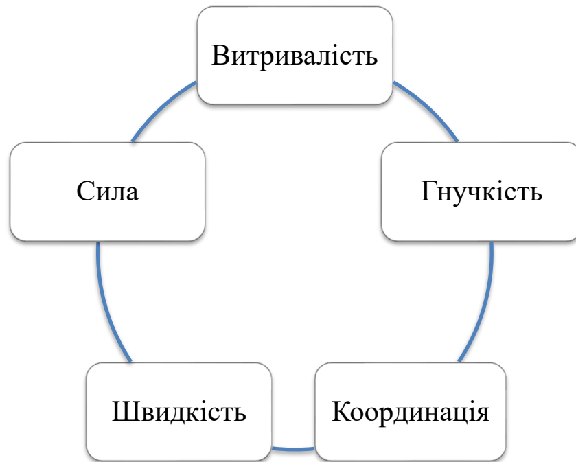
Рис. 1.1. Фізичні якості

Розглянемо характеристику цих якостей та методику їх розвитку.