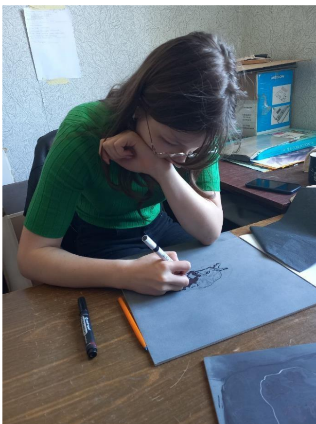
Рис. 15 Перенесення ескізу на лінолеум