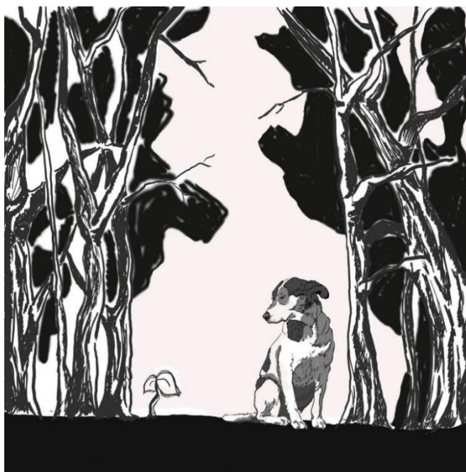
Рис. 7-9. Формування художнього середовища, детальне опрацювання фону та остаточне встановлення ракурсів фігур