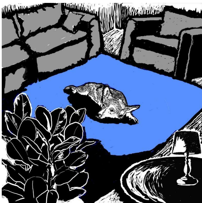
Рис. 14. Розробка ескізу та тоновий пошук