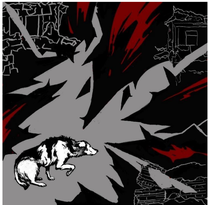
Рис. 1- 4. Тональний пошук та визначення найбільш виразних поз персонажів