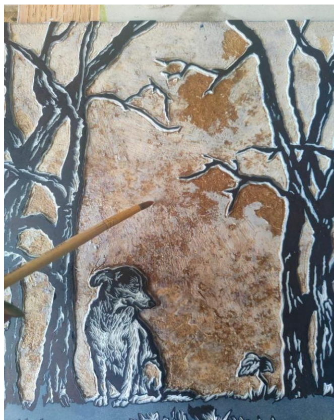
Рис.10-13. Вирізання двох дошок (рисуючої та акцентної)