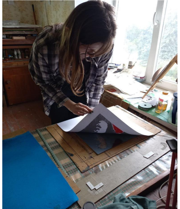
Рис. 16-19. Нанесення типографської фарби на лінолеум та його подальший друк