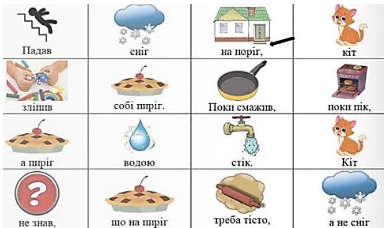
Рис. 2.1. Зображення вірша П. Воронька «Кіт не знав» у мнемотехніці.

Падав сніг на поріг, Кіт зліпив собі пиріг. Поки смажив, поки пік, А пиріг водою стік. Кіт не знав, що на пиріг Треба тісто, а не сніг.