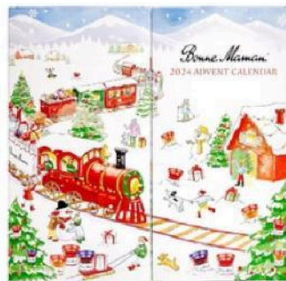
Рис.4 Bonne Maman Advent Calendar 2024 Edition