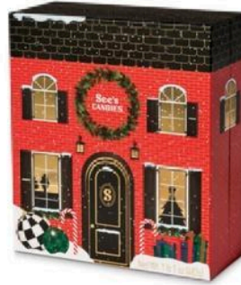
Рис.3 See's Candies Advent Calendar