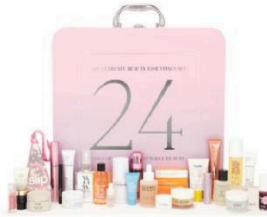
Рис.5 Revolve Beauty 2024 Advent Calendar

Проведений аналіз дав можливість уточнити сегментування адвент-календарів відповідно до трьох основних цінових категорій, що відповідають особливостям запропонованого дизайну і представникам цільової аудиторії: економ-сегмент (вартість до $30): бюджетні варіанти для користування всієї сім'єю з традиційним вмістом (міні-іграшками, паперовими новорічними прикрасами, солодощами тощо); middle-сегмент (вартість $30-$100): набори для молоді, сімей з дітьми, з тематичним наповненням (косметикою, іграшками, високоякісним шоколадом, цукерками, креативними дрібничками тощо); преміум-сегмент (вартість $100 і вище): адвент-календарі для колекціонерів, споживачів ексклюзивних товарів з акцентом на розкіш, високу якість та унікальність.