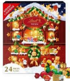
Рис.1 Lindt Teddy Bear Holiday Chocolate Advent Calendar