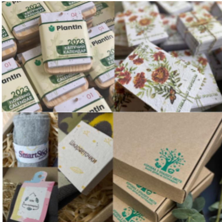
Рис.1. Приклади поліграфії з квітучого паперу та переробних матеріалів

Виробником надаються рекомендації щодо застосування екологічного паперу. По-перше, пропонується замочити папір у воді на 2–3 години. По-друге, підготувати ґрунт, поклавши папір і присипавши тонким шаром землі. При регулярному поливі, перші паростки з'являться через 5–10 днів (Листівки, що проростають, 2024).