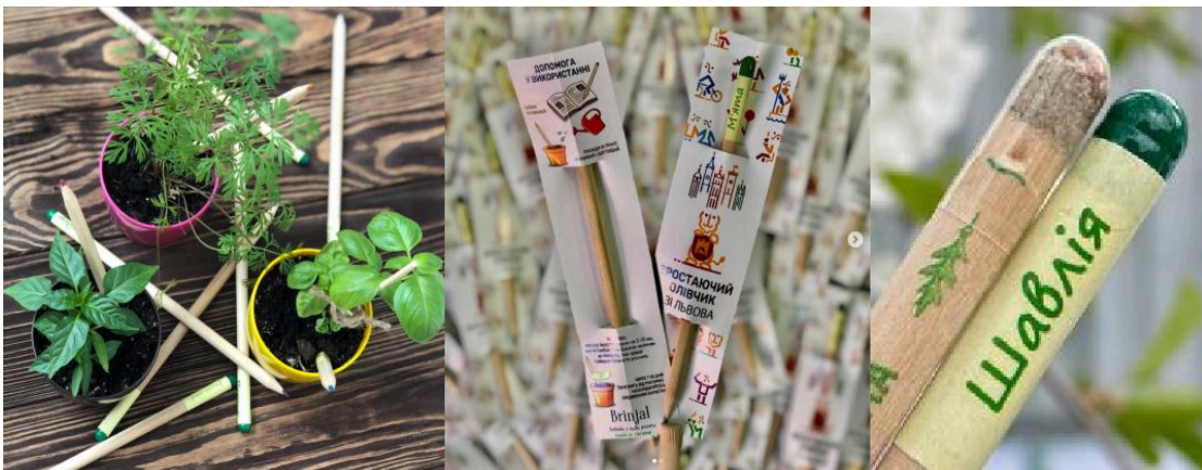
Рис. 3. Проростаючі олівці

Використання олівців із насінням рекомендовано для шкіл, офісів і домашнього використання; в якості корпоративних подарунків для підвищення екологічного іміджу компанії; озеленення міських територій. Коли проростаючий олівець стане надто коротким, радять вставити його капсулу у ґрунт на глибину 2–3 см та поливати, підтримуючи вологість. Через декілька днів насіння почне проростати (Зростаючий олівець, 2024).