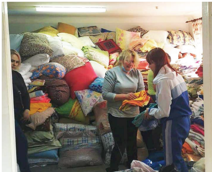
Рис. 2. Участь волонтерів-правників у формуванні фонду одягу і постільної білизни в Центрі тимчасового перебування «Кременчук»

Студенти-правники розвантажували привезену з гуманітарного центру-складу у СК «Політехнік» гуманітарну допомогу, допомагали її сортувати й роздавати населенню, особисто брали участь у формуванні фонду одягу, постільних речей, засобів гігієни, медичних засобів, питної води та харчування для переселенців (рис. 2).