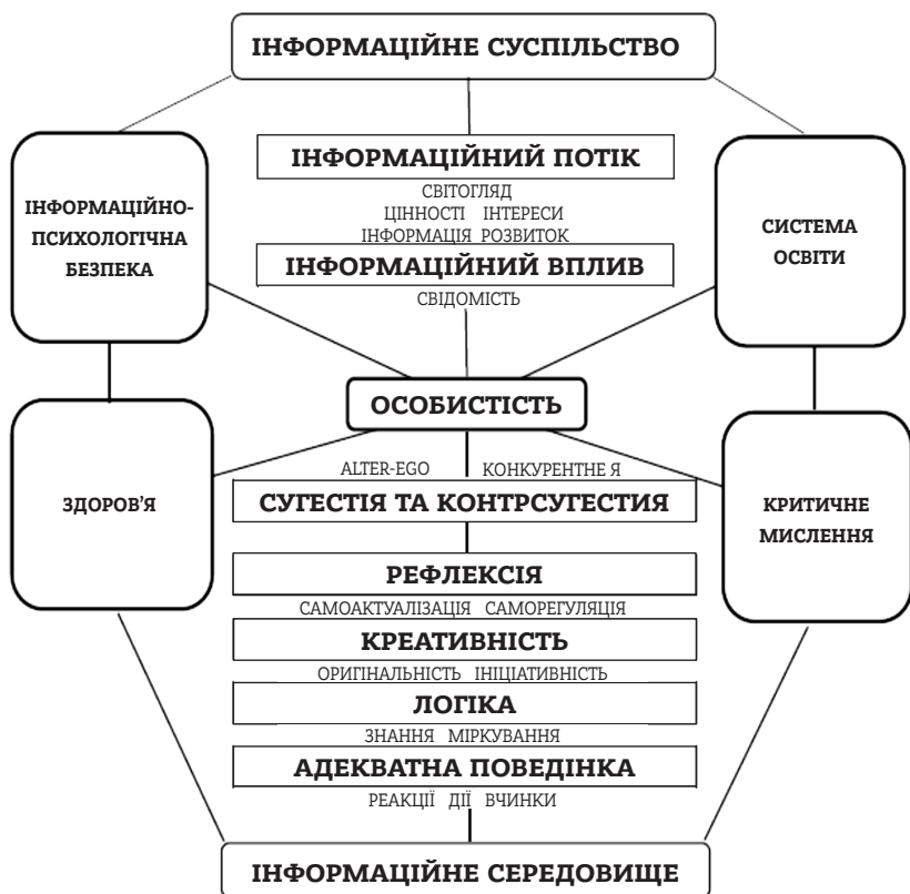
Рис. 2.2. Модель адекватного функціонування особистості в інформаційному суспільстві

За результатами DRI 2021 Україна продемонструвала найбільшу стійкість до зовнішньої дезінформації (Havlíček & Yeliseyev, 2021). Щоб орієнтуватися в інформаційному середовищі, потрібно здійснювати конкретні втручання, які