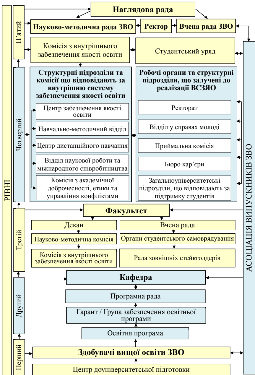
Рис. 1. Інституційна модель системи внутрішнього забезпечення якості вищої освіти