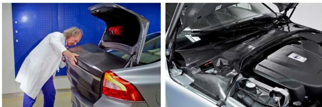
Рисунок 2 – Приклад застосування КМ в автомобілебудуванні

На думку експертів, повна заміна компонентів електромобіля елементами з нового матеріалу дозволить скоротити вагу автомобіля більш ніж на 15%. Це не тільки знизить вартість автомобіля, але зробить його ще більш екологічним.