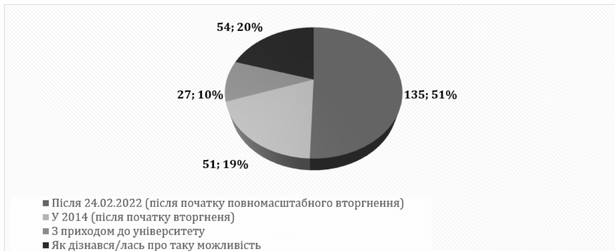
Рис. 2. Відповідь на питання «Коли ви почали свій шлях волонтера?»