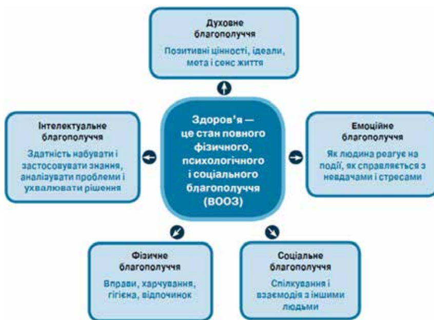
Рис. 1. Модель здоров'я

Усі аспекти здоров'я людини мають розглядатися у взаємозв'язку. Якщо взяти до уваги, що психологічне – це емоційне й інтелектуальне, то отримаємо п'ятивимірну модель здоров'я (рис. 1). Кожен із п'яти вимірів є важливим для загального благополуччя людини (Статут (Конституція) Всесвітньої організації охорони здоров'я ВООЗ).