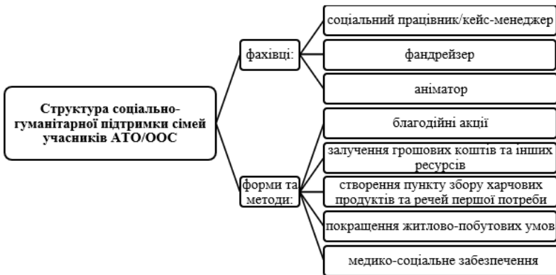
Рис. 3.7. Структура соціально-гуманітарної підтримки сімей учасників АТО/ООС

Форми та методи соціально-гуманітарної підтримки та фахівці, які мають реалізовувати цей блок програми представлені на рис. 3.7.