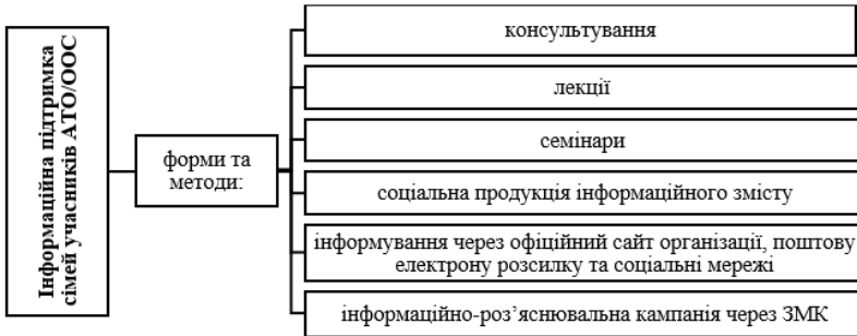
Рис. 3.3. Форми та методи Інформаційного блоку програми «Соціальна підтримка сімей учасників АТО/ООС»