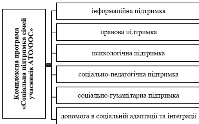
Рис. 3.2. Структура напрямів (тематичних блоків) Комплексної програми «Соціальна підтримка сімей учасників АТО/ООС»

інтеграції», які відповідають видам соціальної підтримки в межах програми (рис. 3.2.). До реалізації кожного блоку програми були залучені фахівці та підібрані форми та методи роботи.