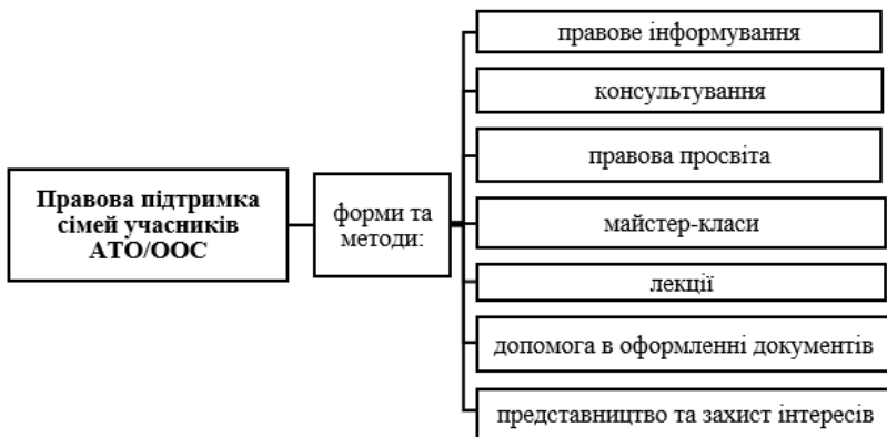
Рис. 3.4. Форми та методи правової підтримки сімей учасників АТО/ООС

Цей блок комплексної програми реалізується переважно юристом із залученням до правової підтримки соціального працівника. Форми та методи роботи відповідно до цього блоку схематично представлені на рис. 3.4.