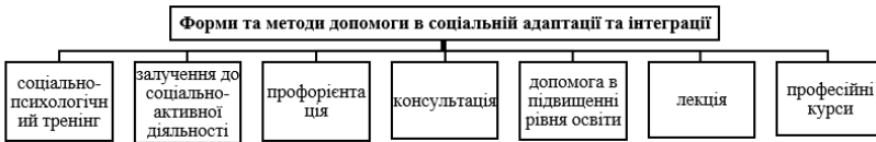
Рис. 3.8. Форми та методи допомоги в соціальній адаптації та інтеграції

подолання неконструктивної фіксації на хворобливому стані. Розширення кола інтересів і контактів, розвиток комунікативних навичок. Визначення життєвих перспектив.