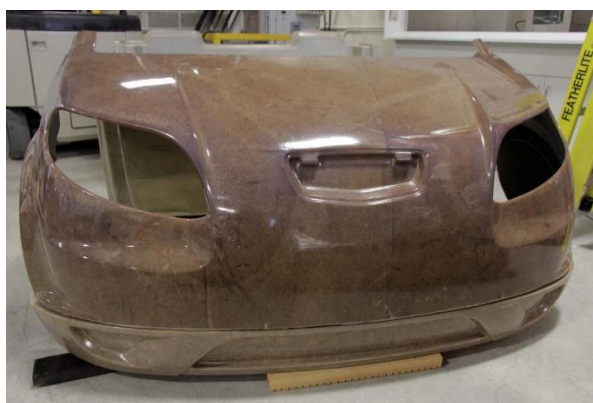
Рисунок 2 – Виготовлений дослідний зразок капота

На рис. 2 наведено фото дослідного зразка капота виготовленого з композитного матеріалу після розрахунків в САD системах.