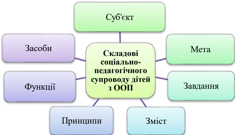
Рис. 2.1. Складові соціально-педагогічного супроводу дітей з ООП