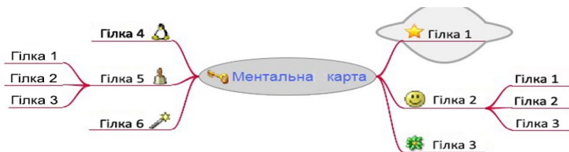
Рис. Шаблон інтелект-карти

Розташувати центральну тему в центрі аркуша. Сформулювати її стисло й точно, та/або подати зображенням. Укласти формулювання теми в коло або овал. Від центральної теми ведіть гілки в різні боки й розміщуйте на них ключові слова, пов'язані з основною думкою. Розширюйте карту. Від уже готових гілок ведіть нові, пишть на них слова, що описують попередні.