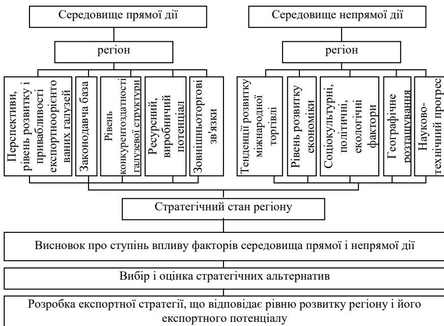
Рис. 1. Фактори впливу на вибір експортної стратегії регіону

Середовище непрямой дії опосередковано чинить вплив на визначення експортної стратегії регіону реалізацією наступних факторів: рівень соціально-економічного розвитку регіону, міжнародна торгівля та тенденції її розвитку, соціокультурні, політичні, екологічні фактори, науково-технічний прогрес, географічне розташування регіону [4]. Під впливом визначених факторів та на основі аналізу їх ступеню впливу доцільно здійснити розробку експортної стратегії регіону з урахуванням рівня його розвитку.