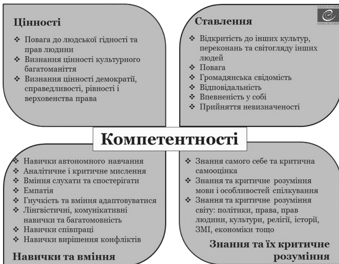
Рис. 1. Рамка компетентностей для культури демократії (Рамка компетентностей, 2018, с. 38)

Безумовно, формування соціальної та громадянської компетентностей має відбуватися через досвід, участь і самостійне навчання. Для практичної реалізації концепції ОДГ / ОПЛ необхідно застосовувати особливі форми навчання, якими педагоги повинні оволодіти достатньою мірою й уміти використовувати їх на практиці за різних обставин. Наведемо основні з них: