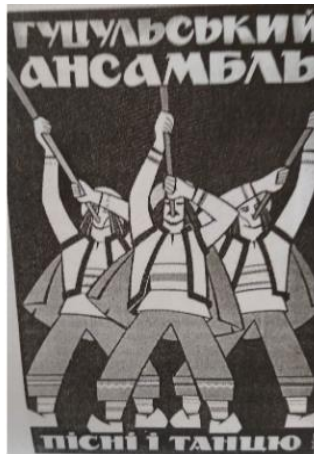
Автор невідомий «Гучульський ансамбль пісні й танцю», 1969р