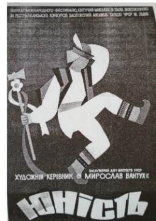
Автор невідомий «Юність», 1969 р