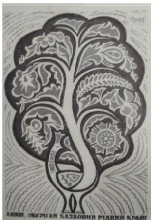
М. Чернюк, «Люби, оберігай казковий рідний край!», 1968 р.

Народні символи України, фігуративні компоненти образотворчості та знаки орнаменту широко вживаються в сучасному дизайні [1].