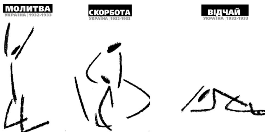
Рис. 4. Серія меморіальних плакатів «Молитва», «Скорбота», «Відчай» (2007–2008 р, О. Векленко)

Характерні риси наскального мистецтва простежуються, наприклад, у серії меморіальних плакатів авторства О. Векленка (Рис. 4.).