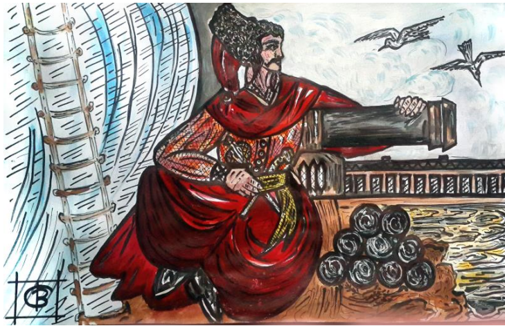
Рис. 1. «Еней». Авторська ілюстрація В. Скребнева

Засобами етнодизайну в рекламних зверненнях популяризується ідея розвитку української держави, мови та культури, національної єдності (Рис. 2.).