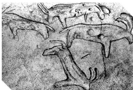
“Чотирьохфігурна композиція грома Бика” період мезоліту

На матеріалі Кам'яної Могили просліджується достатньо довгий період розвитку наскального мистецтва (з XII тисячоліття до н. е. по VII століття н. е.). Це дає ще одну можливість черпати образи не тільки побудови динамічної моделі розвитку художньо-творчої особистості, а й образотворення в графічному дизайні Півдня України, хоч приклади пізнього палеоліту (Печера, печера Ласко у Франції, Капова печера в Росії — 25–12 тис. років до н. е.) свідчать про яскравий, живописно-натуралістичний характер світосприйняття первісних мисливців, але не входять у порівняння з більш стилізованими неолітичними малюнками Кам'яної Могили (Рис. 3).