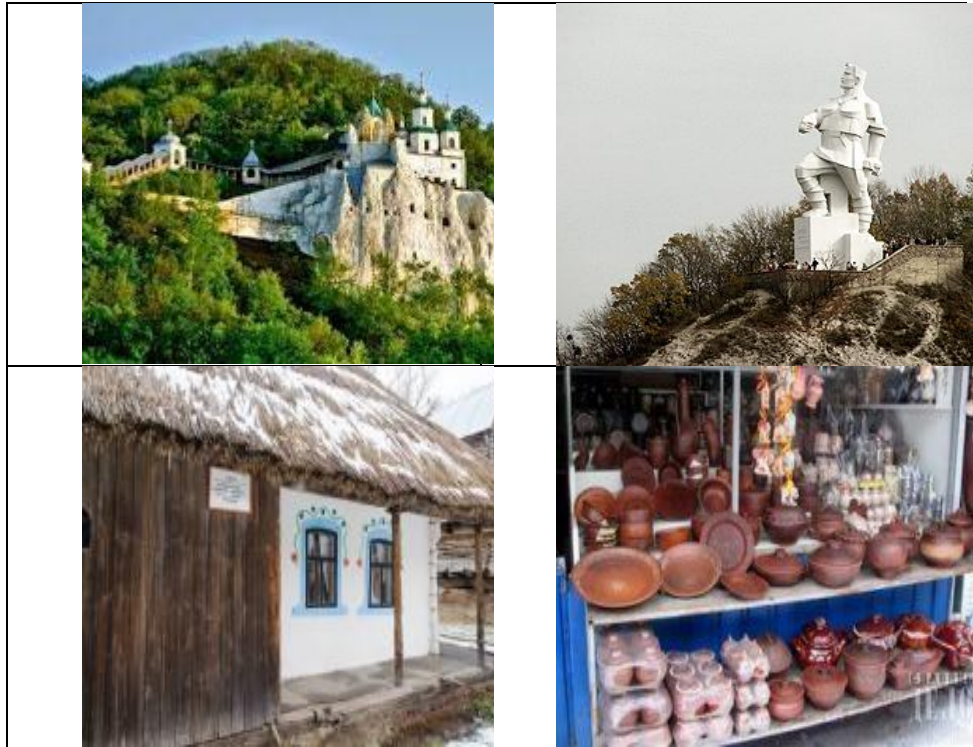
Рис.1. Туристичні об'єкти м. Слов'янська та Слов'янського району (зліва направо та зверху вниз: 1) гора Карачун; 2) регіональний ландшафтний парк «Слов'янський курорт»; 3) озеро Сліпне; 4) озеро Ріпне; 5) Національний природний парк «Святі Гори»; 6) пам'ятник Артему; 7) музей народної архітектури, побуту та дитячої творчості в с. Прелесне; 8) Слов'янський керамічний ринок.