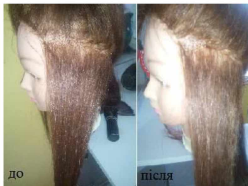
Рисунок 7 – Результат фарбування «DE LUXE SILVER» через тиждень

б) фарба «DE LUXE SILVER» втратила колір, потьмяніла, але сивина не проявилася (рис. 7);