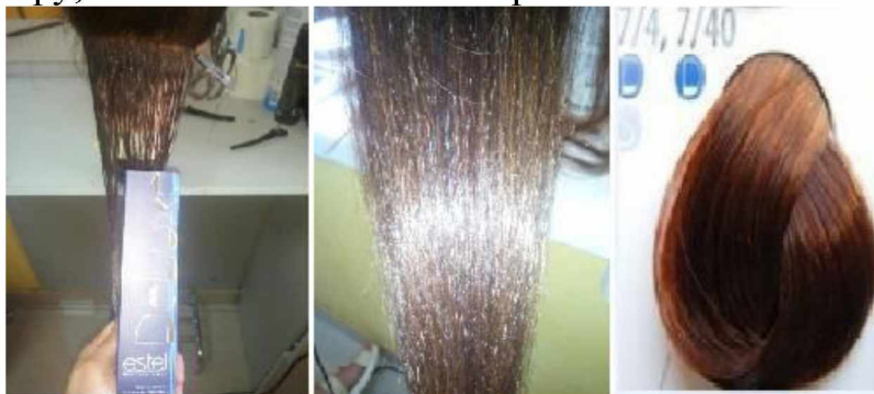
Рисунок 3 – Результат після фарбування фарбою «DE LUXE» 7/4

На пасмі волосся, де застосовувалась фарба «DE LUXE» 7/4 (рис. 3), з наявністю олій, аміака до 1% та додаванням 6% оксигенту (за правилами фарбування від виробника), сивина набула іншого кольору, однак він не відповідав кольору, який зазначений в палітрі.