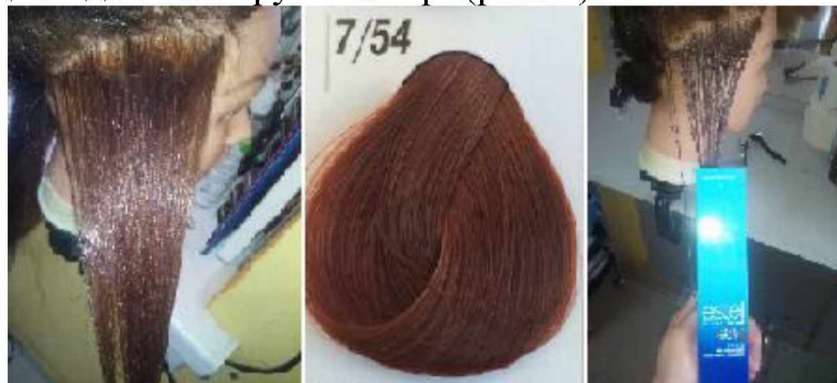
Рисунок 5 – Результат фарбування фарбою «DE LUXE ESSEX» 7/54

На пасмі волосся, де застосовувалась фарба без додавання олій, «DE LUXE ESSEX» 7/54, за наявності аміаку (до 9%) сивина зафарбувалась якісно, колір відповідав кольору в палітрі (рис. 5).