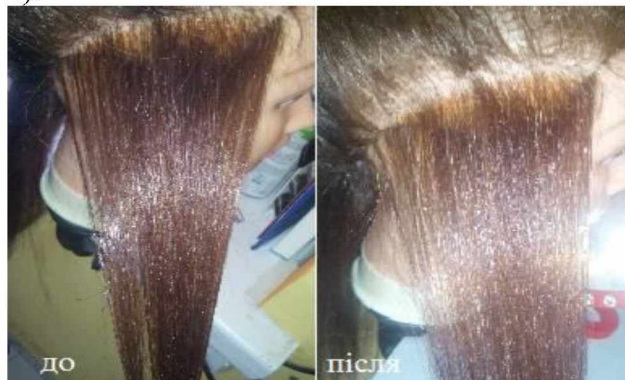
Рисунок 8 – Результат фарбування «DE LUXE ESSEX» через тиждень

- фарба «DE LUXE ESSEX» достатньо стійка, колір майже не змінився, однак сиве волосся почало втрачати колір і відрізнятися від основного кольору, колір тьмяний (рис. 8).