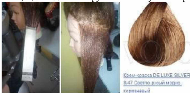
Рисунок 4 – Результат фарбування фарбою «DE LUXE SILVER» 8/47

Сивина на пасмі волосся пофарбованою спеціальною фарбою для сивини «DE LUXE SILVER» 8/47, з наявністю олії та аміака до 9%, з додаванням 9% оксигенту (за правилами фарбування виробника), була зафарбована 100%, колір насичений та сяючий, відповідає кольору зазначеному в палітрі (рис. 4).