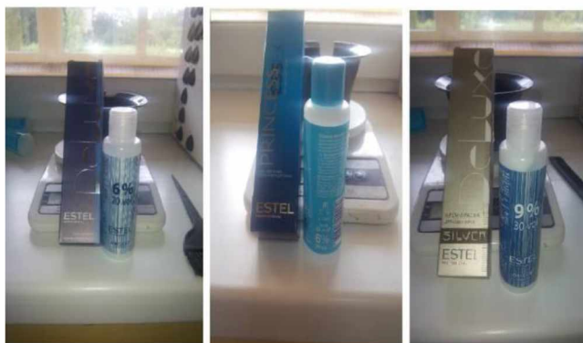
Рисунок 2 – Фарби для волосся та окислювач

Під час фарбування були дотримані усі правила зазначені виробником у супровідних інструкціях. Виробник стверджує, що фарба за правильним застосуванням окислювача та за наявності золотавого відтінку у нумерації фарби, повинна зафарбовувати сивину 100% та гарантує належну стійкість фарби. До золотавих відтінків відносяться такі номери фарби: 3 – золотавий, 4 – золотаво-помаранчевий, 5 – червоний, які й були використані для порівняння. Фарбуванню підлягали окремі пасма волосся на одному манекені для подальшого спостереження за стійкістю фарбування за однакових умов «експлуатації» (перебування у приміщенні за звичайних умов щодо