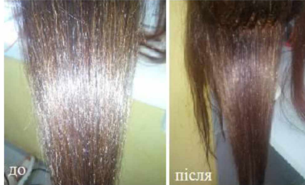
Рисунок 6 – Результат фарбування «DE LUXE» через тиждень

а) фарба «DE LUXE» стійка, колір не змінився, як раніше сяє і має більш гладку структуру, сивина залишилася золотавого відтінку (рис. 6).