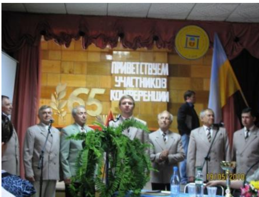
Выступает ансамбль Горизонт