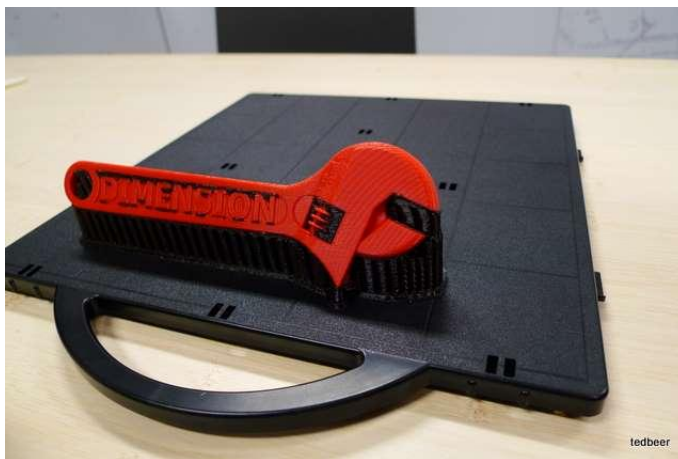
Рис. 2. Ключ - що виготовлений на 3D-принтері

Для друку двома кольорами або одним кольором з допоміжним матеріалом використовується принтер з подвійним екструдером. На сьогодні ця технологія в аматорських принтерах ще не відпрацьована. STL формат, обраний в якості стандартного серед любителів, не підтримує кілька кольорів. Але апарати вже доступні, так що ці проблеми вже в процесі вирішення. Пластик для друку продається бухтами у вигляді прутка різного діаметру ціною порядку 40-60 $ за кг, водорозчинний коштує дорожче (90 $). У різних видів пластику (і інших матеріалів, наприклад шоколад) - різний діапазон робочих температур. Для підтримки оптимальної температури використовується термодатчик. Щоб забезпечити точність друку деталей не повинна рухатися з місця, тому роблять так, щоб вона прилипла до поверхні платформи. http://habrahabr.ru/post/136340/ Так як пластикова деталь друкується довго, то й остигає вона нерівномірно. Шари надруковані раніше - остигають раніше. Тому деталь прагне деформуватися - зігнутися. З одного боку прилипання повинно бути достатньо сильно, щоб не дати відірватися деталі від платформи при охолодженні, з іншого - досить слабо, щоб можна було відірвати її руками по закінченні процесу не пошкодивши [10].