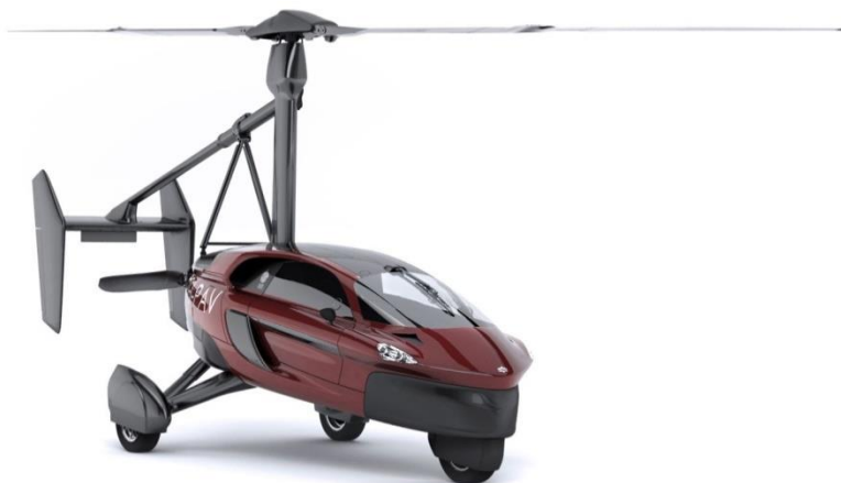
Рисунок 8 – Liberty. Щоб злетіти, потрібно 90 метрів полоси

Цього року літаючі автомобілі з фантастичних продуктів остаточно перейшли в розряд серійних. Замовлення на Liberty від компанії PAL-V почали приймати ще в лютому. З точки зору наземного транспорту, це трицикл, а з точки зору повітряного – авто: щось на зразок літака, підйомну силу якого створює не крило, а гвинт на кшталт вертолітного. На відміну від вертольота, для зльоту такої конструкції потрібно місце для розбігу, в разі Liberty – це від 90 метрів дороги. Машина оснащена 100-сильним бензиновим двигуном, який на дорозі забезпечує максимальну швидкість 160 км/год, а в небі – 180 км/год. Для перетворення наземної машини в літальний апарат потрібно близько 10 хвилин – щоб розкласти лопаті заднього гвинта.