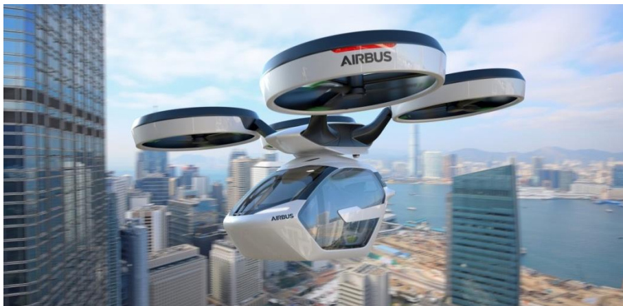
Рисунок 9 – Капсула з пасажирами автономна

Але “розумні” функції описаних автомобілів меркнуть перед інтелектуальною потужністю і емоційним багатством представлених в цьому році концептів машин найближчого майбутнього – тих, на чому ми зможемо прокататись буквально через кілька років. Примітно, що ці чотириколісні інтелектуали практично всі відносяться до електромобілів. І це ще одна прикмета часу: такі концепти все частіше з'являються не тільки на автомобільних форумах, а й на виставках електроніки і мобільних технологій. А серед їхніх авторів миготять компанії, раніше на автомобілебудуванні не спеціалізовані.