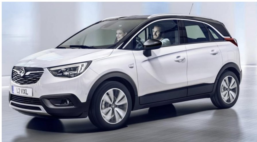
Рисунок 3 – Crossland X. Обладнаний панорамною камерою заднього виду

Власне, тут ми маємо справу ще з однією вираженою тенденцією сучасного автомобілебудування: після того як в 2007 р система кругового огляду з'явилася в авто Nissan, вона знайшла собі місце в моделях і інших провідних брендів - Mercedes-Benz, BMW, Toyota, Lexus, Audi, Land Rover, Volkswagen. А в цьому році в Женеві Citroen представив концепт-кар позашляховика C-Aircross - з дисплеєм, який проектує зображення прямо на лобове скло, і з камерами замість бічних вікон. Так що все, що відбувається навколо автомобіля можна побачити в дзеркалі заднього виду.