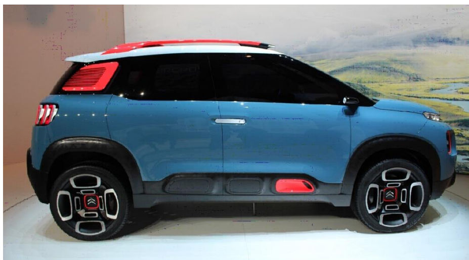
Рисунок 4 – Crossland X. Обладнаний панорамною камерою заднього виду

Crossland X продемонстрував ще одну тенденцію: її в цій моделі є автоматична система екстреного гальмування, яка здатна реагувати і на автомобілі, і на пішоходів. Коли машина наближається до такого об'єкта на небезпечну відстань, водія попереджають світлозвуковим сигналом. Якщо це не допомагає, система автоматично пригальмовує. Комплекс активної безпеки варто і на свіжій версії кросовера XV від компанії Subaru. Крім автоматичного гальмування, вона включає в себе адаптивний круїз-контроль (автоматично підтримує постійну швидкість руху) і підсистему попередження про вихід із займаної смуги