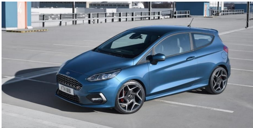
Рисунок 1 – Fiesta ST. Може їхати навіть на двох циліндрах для економії

В останнi роки збiльшення лiтрової потужностi супроводжується все бiльш помiтним трендом - до "стиснення" габаритiв двигуна. Цю тенденцiю стали називати даунсайзiнг (англiйське downsizing так i перекладається - "зменшення розмiру"). Мета проста: коли двигун при тiй же потужностi стає менше i легше, можна зменшити i полегшити (а частенько - i здешевити) автомобiль в цiлому. При цьому він буде мати ще бiльш високi динамiчнi характеристики.