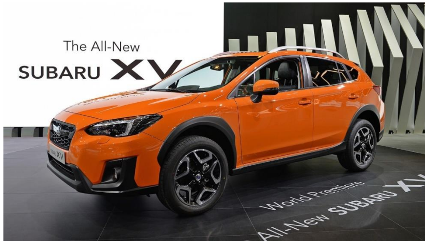
Рисунок 5 – Subaru XV. Контролює дорогу не гірше за водія

руху. Все разом це покликане вберегти замріяного водія від серйозних неприємностей. Близька за функціями система автономного управління, що дозволяє без участі водія рухатися в межах однієї смуги автомагістралі (вона не тільки попереджає про вихід за її межі, але ще і сама підрулює), вважається головним нововведенням оновленої версії "паркетника" Qashqai від Nissan.