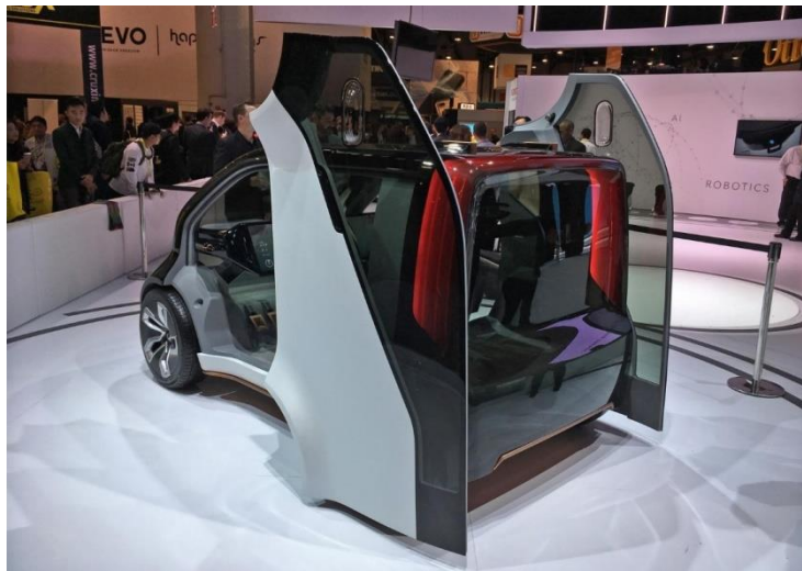
Рисунок 6 – NeuV. Підлаштовується під стиль водіння

Honda на CES 2017 представила концепт автономного електромобіля NeuV. Його система штучного інтелекту відрізняється тим, що здатна розпізнавати емоції водія і підлаштовуватися під настрої власника.