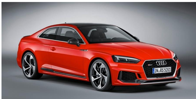
Рисунок 2 – Audi RS5. На трьох циліндрах розганяється до 100 км за 3,9 секунди

Не минув даунсайзiнг i таке далеке від думок про економію співтовариство автомобілів, як потужні спортивні купе. Так, нова версія Audi RS5, також представлена в Женеві, має зменшений в порівнянні з попереднім поколінням двигун (2,9 л замість 4,2 л) потужністю 450 л. с., що дозволяє розігнатися з місця до 100 км/год за 3,9 сек. І навіть серед "суворих позашляховиків" з'явилися моделі з трьома циліндрами.