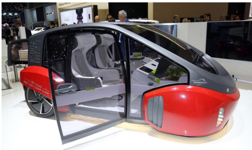
Рисунок 10 – Oasis. Розуміє навіть жести. Але навіщо в авто міні-сад – неясно

Наприклад, електромобіль, концепт якого на виставці електроніки CES-2017 представила компанія Fiat Chrysler Automobiles, здатний практично самостійно переміщатися по міських вулицях, але присутність і періодичне підключення водія все ще потрібно. Але, на жаль, ці рішення вже виглядають трохи застарілими на тлі повністю автономних систем, анонсованих іншими виробниками. Як відомо, ще восени минулого року Tesla Motors оголосила, що незабаром її машини зможуть повністю обходитися без водія-людини. На Женевському автосалоні Volkswagen Group представила концепт електромобіля Sedric, керованого штучним інтелектом, який володіє повною автономністю. Аж до того, що йому, як стверджує компанія, можна буде довірити самостійно відвезти дітей в школу. Більш того, в цій машині взагалі не передбачено традиційне місце водія – в салоні розташовані два двомісні дивани обличчям один до одного. Управляти електромобілем можна буде за допомогою голосових команд.