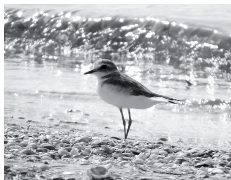
Рис. 8. Морской зук.

Необходимо отметить, что за время наблюдений отмечено 7 видов птиц (полевой лунь, луговой лунь, авдотка, кулик-сорока, галстучник, морской зук (рис. 8),