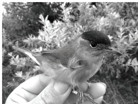
Рис. 5. Черноголовая славка.

Наиболее полно было представлено семейство Славковые ( Sylviidae ), 10 видов из 14 известных. Многочисленными были пеночка-