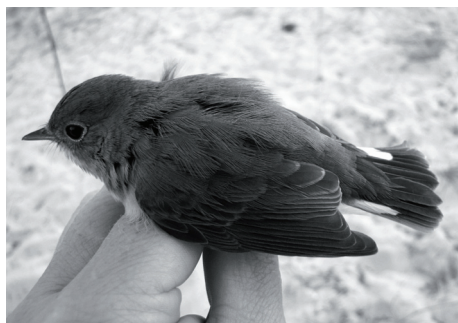
Рис. 7. Малая мухоловка.