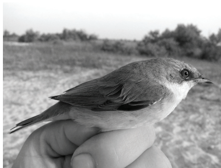
Рис. 6. Славка-завирушка.