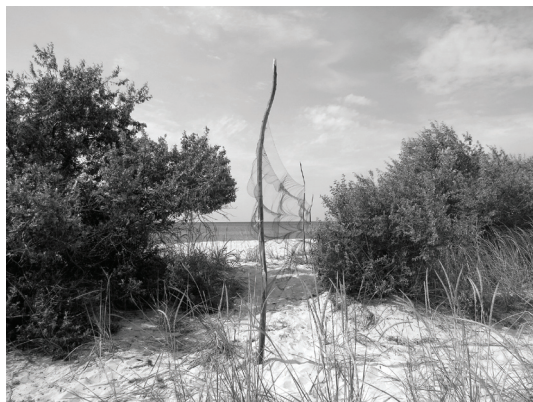
Рис. 2. Паутинные сети.