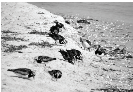
Рис. 4. Камнешарки.