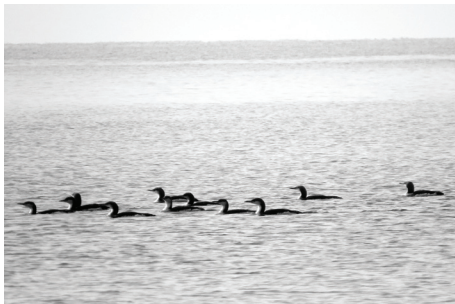
Рис. 3. Чернозобые гагары.