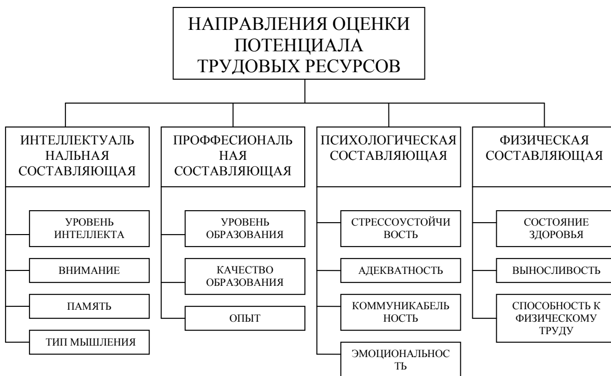
Рис. 2. Направления оценки потенциала трудовых ресурсов сельских территорий

Полученные результаты анкетирования позволили сформировать основной список составляющих потенциала трудовых ресурсов. Обработав полученные результаты, мы выявили наиболее значимые составляющие потенциала трудовых ресурсов. На рисунке 2 представлена группировка составляющих потенциала трудовых ресурсов на основе ответов экспертов.