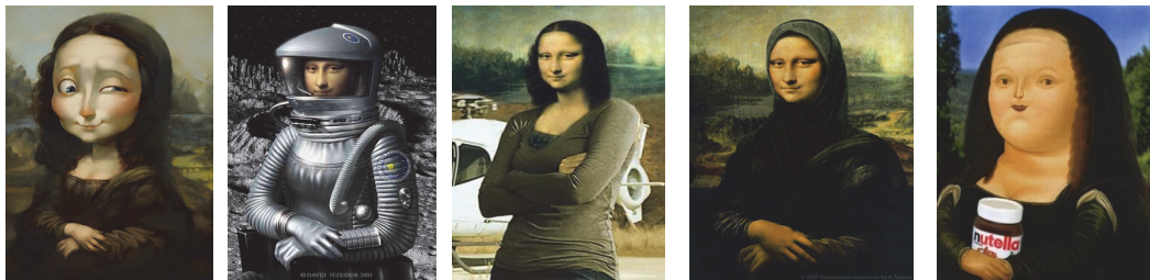
Рис.1 Варіації мема «Джоконда».

кампанії бувають спланованими у рамках “вірусного маркетингу”. Така популярність недовговічна і ситуативна, тому що увага аудиторій переключається на інші “подразники” – нові події, нові твори, як глобальні, так і локальні. Інший подібний концепт – мем – упроваджений ще у 1970-і роки Річардом Докінзом для означення одиниці, первинного елементу культурної еволюції, який постійно конкурує з іншими мемами за реплікацію / повторення шляхом проникнення і знаходження в свідомості носіїв і постійної дифузії [8]. Поняття «меми» та їх комплекси – «мемплекси» – стосувалися різноманітних популярних ідей / ідеологій, гасел, приказок, моди, свят, навичок і т.ін., тобто текстів (в широкому сенсі) і практик. Дифузія мемів заснована на комбінації, реплікації і варіативності. “Успішність”, довговічність мема залежить від його здатності відтворюватися у різних контекстах і гнучкого пристосування до мінливих середовищ, обставин, ситуацій. Для того, щоб образ Джоконди був впізнаваним у будь-якому куточку земної кулі, треба весь час інкорпоровати його у різні інформаційні і медійні продукти, змінювати модальність, включно з обігриванням і пародіюванням (рис.1).