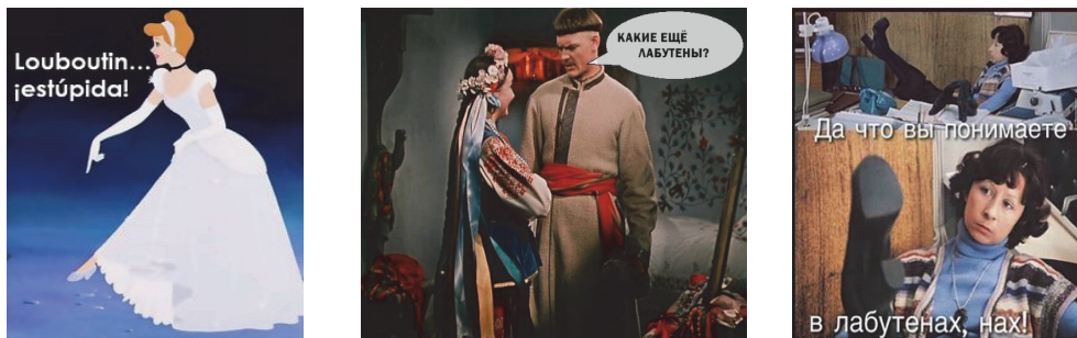
Рис. 2 (а, б, в). Варіації мему «Лабутени».

У нашому прикладі досить важко віднайти такий емерджентний мем-пародію, який за цією схемою має бути аматорським і викликати подальшу хвилю поширень і міметичних наслідувань. В даному випадку, для пісні “Експонат”, яку до цього виконували зі сцени і записи транслювали у YouTube , на нашу думку, емерджентним мемом став комерційний відеокліп на пісню. Саме він набуває популярності і породжує енергію пародіювання, а також стимулює використання ключових фраз його шанувальниками, виготовлення за його сюжетом мемів-картинок (див. рис. 2). Як пишуть на одному із російських сайтів у січні 2016 р. із підбіркою мемів на цю тему: «Після виходу кліпу “Експонат” групи “Ленінград” вся країна розділилась на три табори: на лабутенах, проти лабутенів и ті, хто ще не бачили і не знають, про що мова. В інтернет одразу посипалось сила-силенна приколів, пов’язаних з цією піснею» [12].