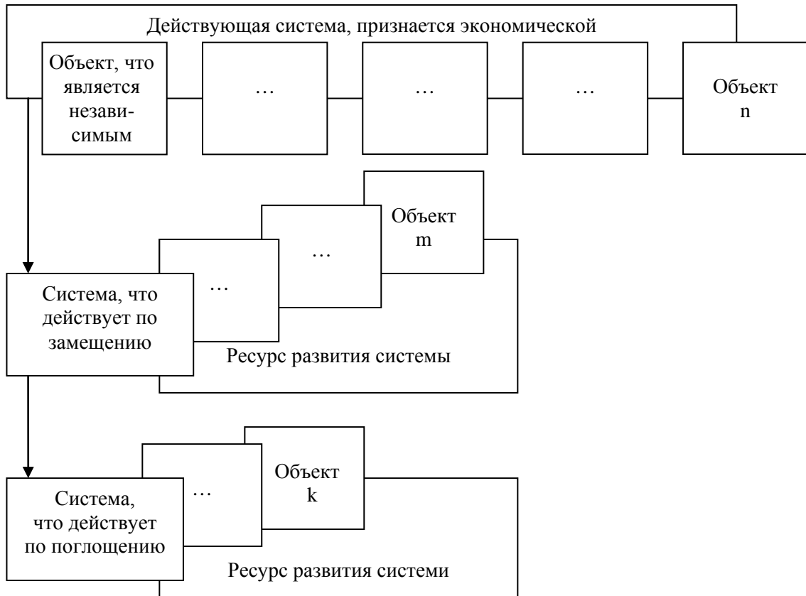
Рис. 1. Схема-функция развития экономической системы объектов «Спортивный бизнес»

траектории. На рис. 1 представлен механизм движения функции, а на рис. 2 – аргумента. Переставляя их местами, изменяется и их роль. Основа взаимного влияния находится в зависимости от приоритетности, устанавливаемой при постановке задачи.