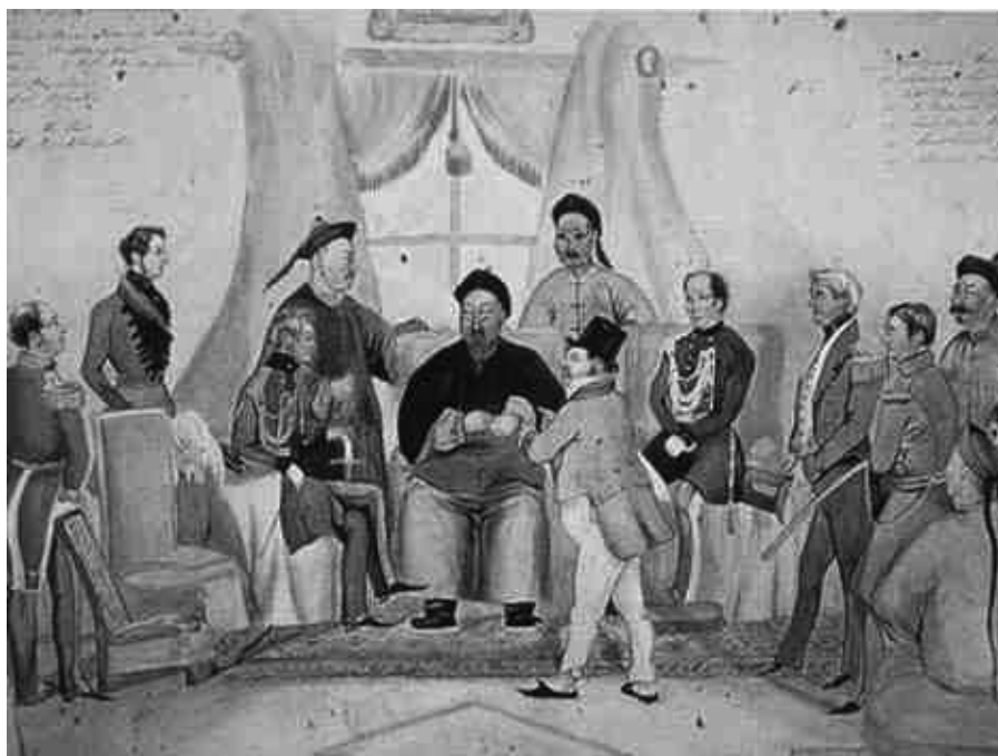
Представители западных держав на встрече с Линь Цзэсюем

22 марта все улицы в Кантоне, кроме главной, были перекрыты. Иностранцы были заперты в своих резиденциях, а джонки перекрыли вход для их кораблей на реку Вампоа, которая протекала у Кантона. 25 марта Линь заявил, что все спорные вопросы отныне будут решаться вместе с консулами западных стран.