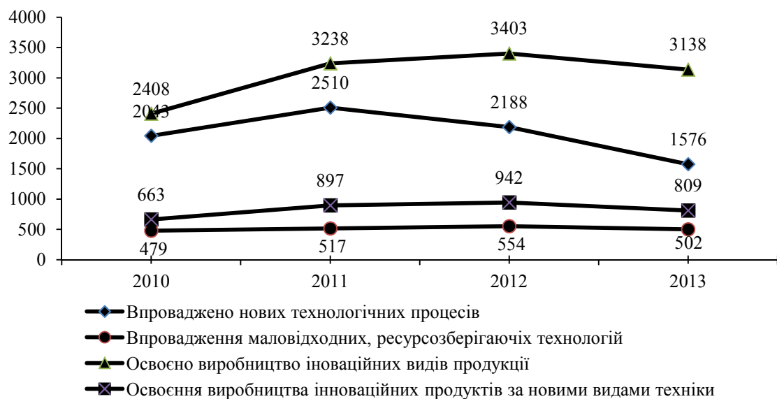
Рис. 2. Впровадження інновацій на промислових підприємствах (складено авторами за даними [7])

Впровадження інновацій на промислових підприємствах здійснюється через впровадження нових технологічних процесів, маловідходних ресурсозберігаючих технологій, освоєння виробництва інноваційних видів продукції та інноваційних продуктів за новими видами техніки.