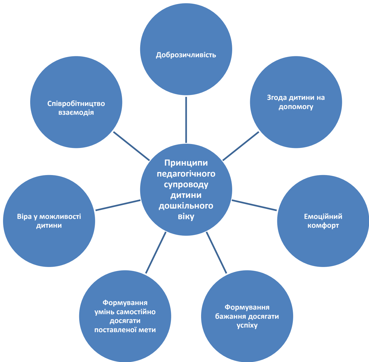
Рис. 2. Принципи педагогічного супроводу дитини дошкільного віку

Отже, основними принципами педагогічного супроводу дитини дошкільного віку є :