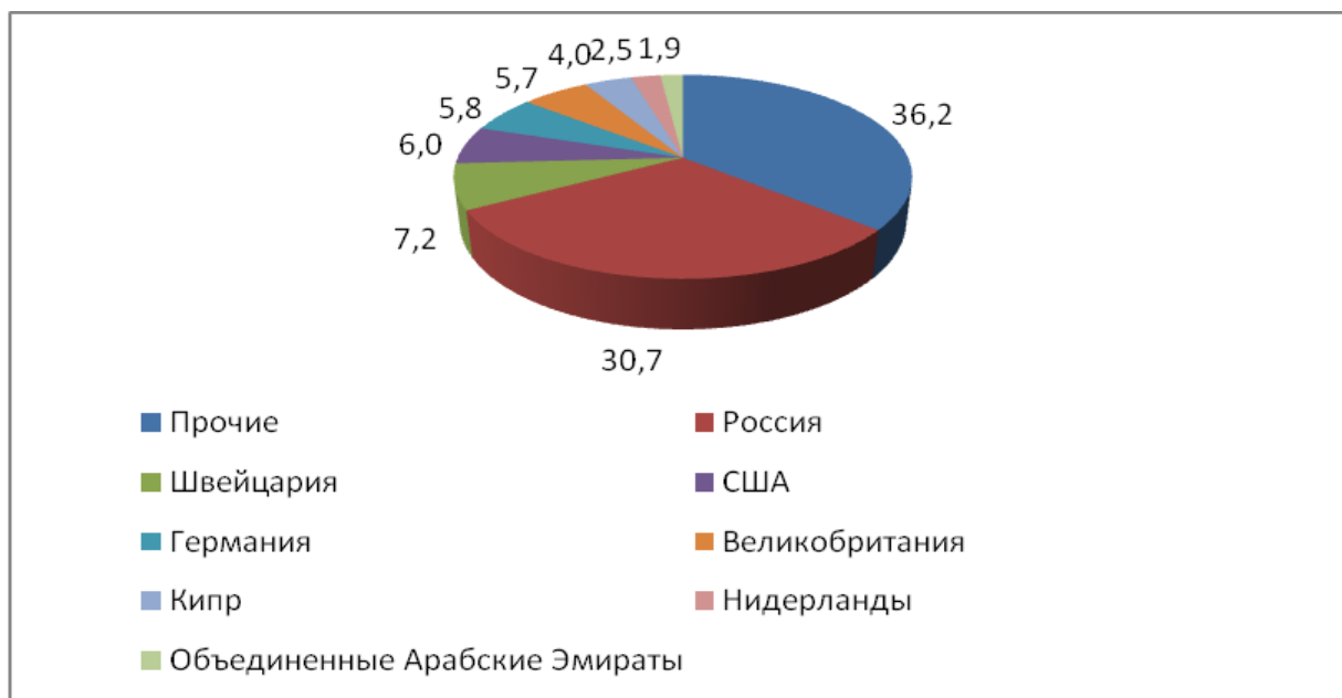
Рис. 3. Основные страны-экспортеры услуг в 2014 г. Fig. 3. The main partner countries exports of services in 2014

Основными странами-экспортерами услуг были Россия (30,7%), Швейцария (7,2%),