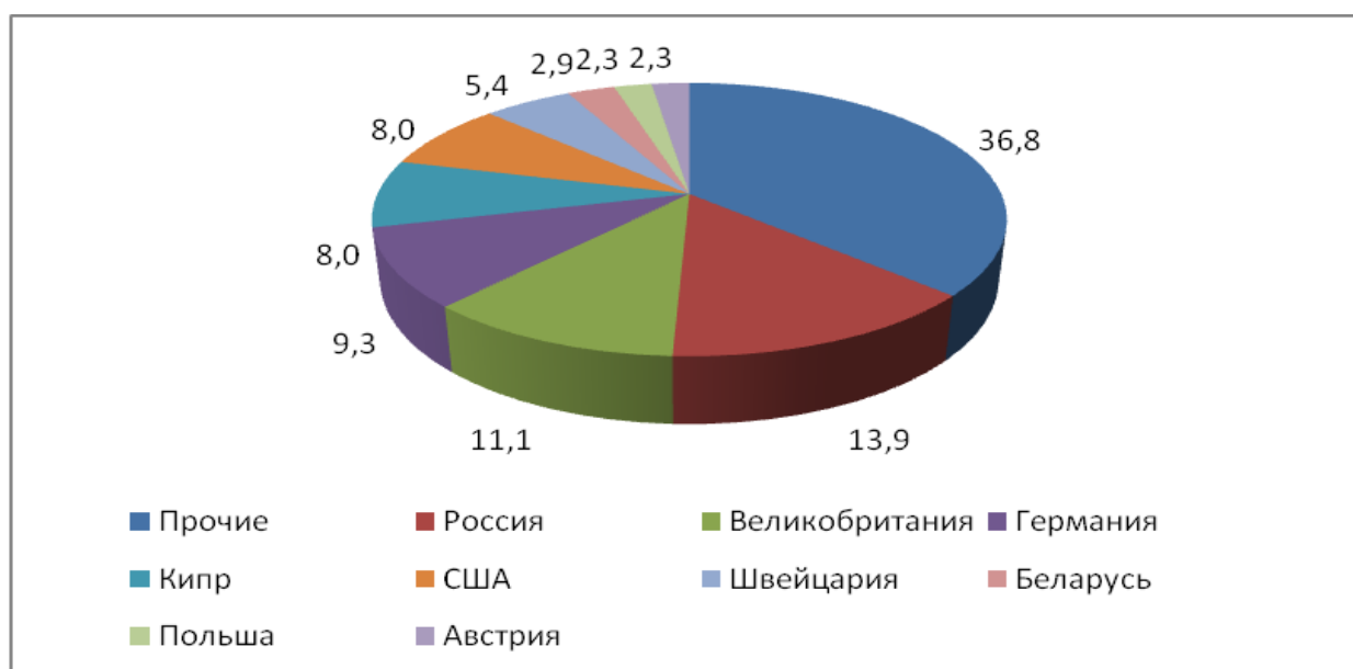
Рис. 4. Основные страны-импортеры услуг в 2014 г. Fig. 4. The main partner countries of import of services in 2014

США (6,0%), Германия (5,8%), Великобритания (5,7%).