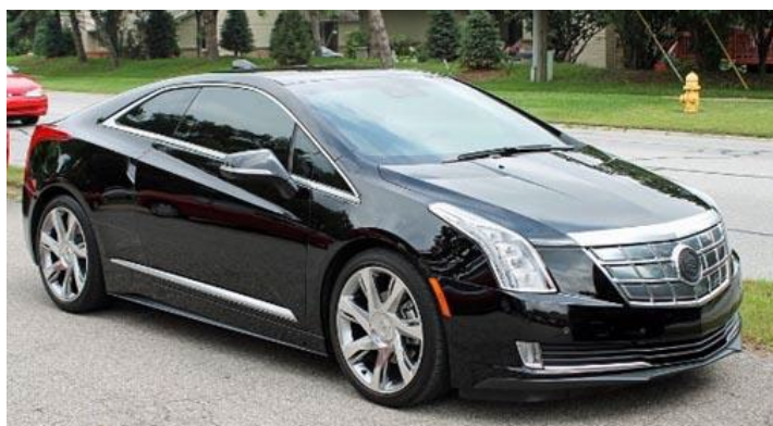
Рис. 1. 2014 Cadillac ELR

Прикладом PHEV є, модель Chevrolet Volt, що випускається концерном General Motors з 2010 року. Cadillac ELR – це дводверне чотиримісне розкішне гібридне компактне купе з можливістю підключення до електромережі, яке виробляється та продається компанією Cadillac з 2014 року. Використовуючи доопрацьовану версію трансмісії Volttec EREV від Chevrolet Volt, літій-іонний акумуляторний блок ELR забезпечує запас ходу на електротязі 37-39 миль (60-63 км) та максимальну швидкість 106 миль/год (171 км/год).