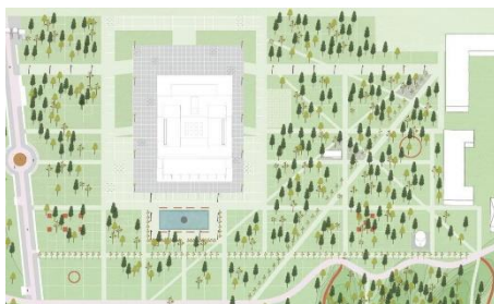
Рис. 2.1. Ситуаційний план скверу.

Ілюстрації позначають словом «Рис.» і нумерують послідовно в межах розділу (за винятком ілюстрацій, поданих у додатках). Номер ілюстрації складається з номера розділу й порядкового номера ілюстрації, між якими ставиться крапка. Назву і слово «Рис.» починають з великої літери. Номер ілюстрації, її назва й пояснювальний підпис розміщується безпосередньо під ілюстрацією, наприклад: