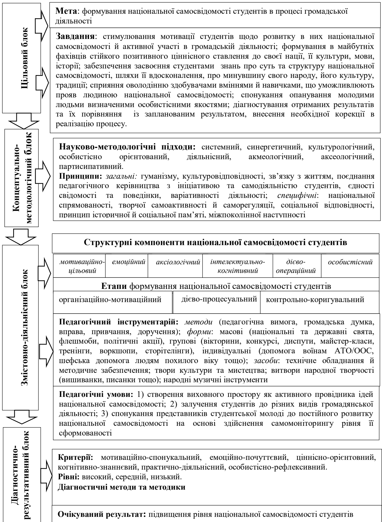
Рис. 1 Система формування національної самосвідомості студентської молоді в процесі громадської діяльності