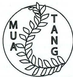
Рис. 1. Логотип. Варіант 1

Варіант 2: А1 Б2 В1 Г1 Д2 Е3 Ж2 З1. Абстрактна форма. Лінія. Стилізація рослини. Шрифт (латиниця). Графічне зображення меблів. Коричневий колір. Етнічна символіка. Динамічна композиція (див. рис. 2).