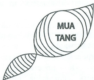
Рис. 2. Логотип. Варіант 2

Варіант 2: А1 Б2 В1 Г1 Д2 Е3 Ж2 З1. Абстрактна форма. Лінія. Стилізація рослини. Шрифт (латиниця). Графічне зображення меблів. Коричневий колір. Етнічна символіка. Динамічна композиція (див. рис. 2).