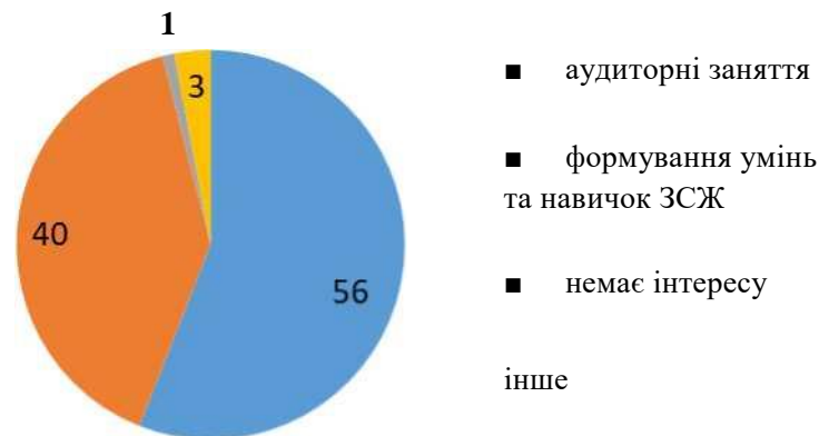
Рис. 2. Засоби доведення інформації до здобувачів вищої освіти щодо здорового способу життя

Було отримано інформацію (рис. 2), що студенти отримують основну інформацію про здоров'я людини та способи його збереження на заняттях з різних дисциплін академії (56%), формування умінь та навичок, необхідних для здоров'я - на заняттях фізичного виховання, рухливих та спортивних ігор, під час спортивних змагань тощо (40%).