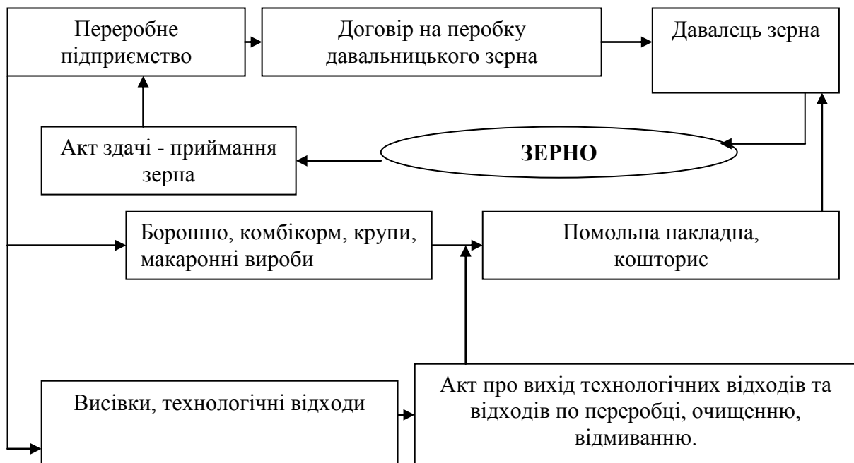
Рис. 2. Логічна схема давальницької переробки зерна

Розглянуто діяльність елеватора з позицій економіко-математичного моделювання як логістичну систему просування матеріальних зернових потоків.