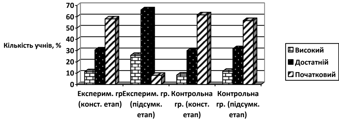
Рис. 2. Динаміка сформованості рівнів здоров'язбережувальної поведінки молодших школярів засобами українських народних традицій

збільшення спостерігається від 11,3 % до 25,8 % (на 14,5 %), що на 11,1 % більше, ніж у контрольній групі. Цей процес пояснюється тим, що учні, які досягли високого рівня, здатні до аналізу реальних ситуацій й самоаналізу власної діяльності щодо процесу формування здоров'язбережувальної поведінки, стали відчувати потребу в саморозвитку. Кількість молодших школярів, у яких виявлено достатній рівень сформованості здоров'язбережувальної поведінки на основі українських народних традицій, збільшився у контрольній групі від 30,0 % до 31,7 % (лише на 1,7 %), а в експериментальній групі – від 30,6 % до 66,1 % (на 35,5 %), що пояснюється засвоєнням молодшими школярами знань та вмій з здоров'язбережувальної поведінки й є перспективою розвитку до високого рівня; кількість молодших школярів, у яких виявлено початковий рівень , зменшилась у незначній мірі в контрольній групі від 61,7 % до 56,6 % (на 5,1 %), а в експериментальній групі спостерігається значне зменшення – від 58,1 % до 8,1 %, що пояснюється збільшенням кількості учнів із високим та достатнім рівнем сформованості здоров'язбережувальної поведінки засобами українських народних традицій.