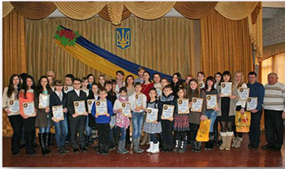
Солов'їними стежками, 2012 р.