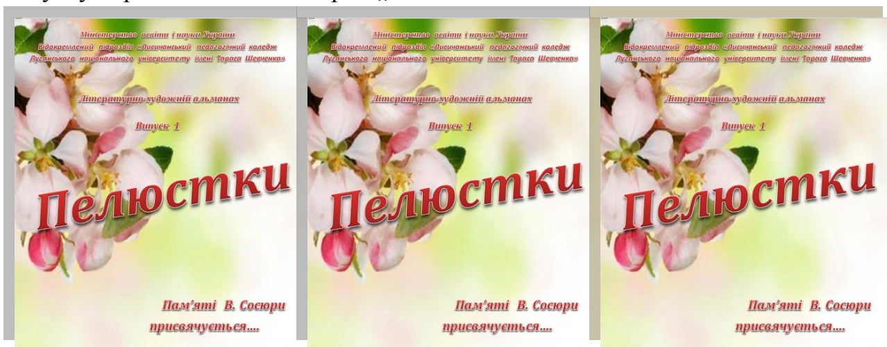
Поетична збірка „Пелюстки”, 2000 р.

знайомились з поезією рідного краю, охоче приєднались до укладання й випуску першої поетичної збірки „Пелюстки”.