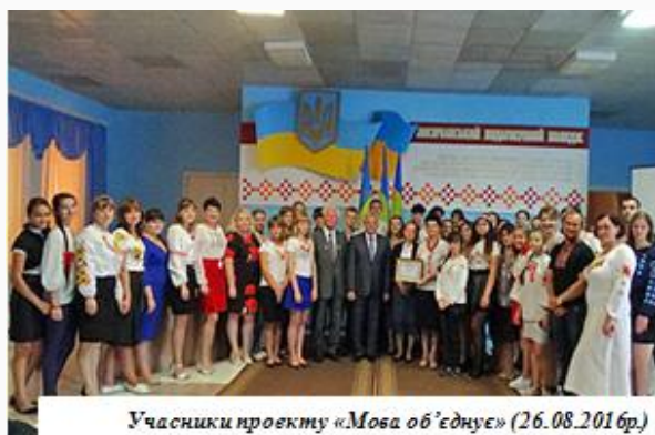
Учасники проекту «Моя об'єднує» (26.08.2016р.)

Поетичне слово, яке лунало, було духовним джерелом невичерпної любові до рідної землі, нашої соборної України. Воно було віщим, бо в ньому відчувалася надія, заповітним, бо воно закликала до волі. Ця рекордна подія не тільки історична сторінка в житті Лисичанського педагогічного коледжу, не тільки демонстрація іміджу й утвердження авторитетності на освітянській ниві Луганщини. Викладачі циклової комісії загальної філології забезпечували організацію й проведення цього урочистого заходу.