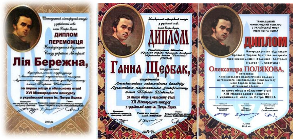
Студенти-переможці у філологічних конкурсах різних років