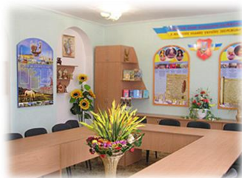
Кабінет-музей „Сучасного українознавства”, 2008 р.

роботі зі студентами коледжу, учнями шкіл, учителями, місцевими письменниками. Під її керівництвом викладачам філології вдалось створити потужну науково-методичну, культурно-історичну платформу для вивчення українознавства та краєзнавства – кабінет-музей „Сучасного українознавства” як культурний та науковий осередок не лише для викладачів і студентів коледжу, а й усього міста та області.